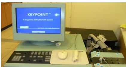
圖一 肌電圖儀器圖