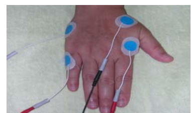
圖三 神經傳導檢查