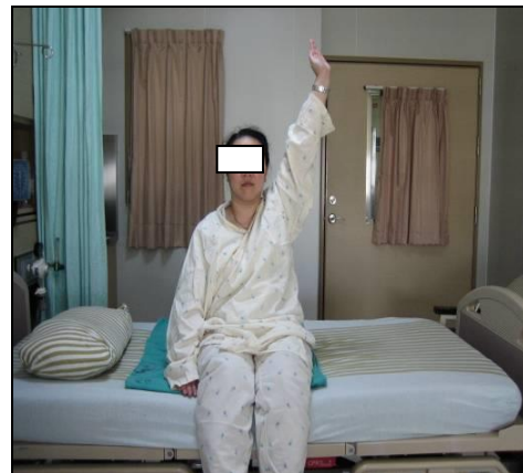
圖六 右手平直抬高過肩