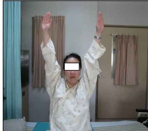
圖四 坐起-雙手平直抬高過肩