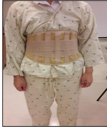
圖二十 使用束腹帶