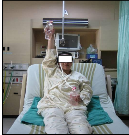
圖八 左手舉水瓶，平直抬高過肩