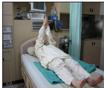
圖一 雙手舉至胸前