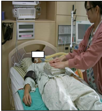
圖十九 砂袋放在腹部