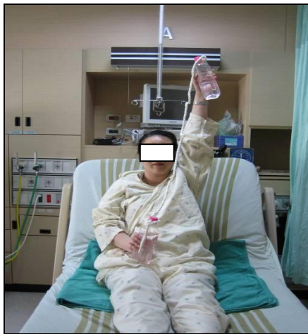
圖九 右手舉水瓶，平直抬高過肩

二、下肢運動：主要是改善活動的耐力。分為抬腿運動、下床坐椅、踩固定式腳踏車、原地踏步運動及使用輔助物步行訓練。