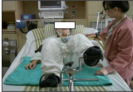
圖十三 床上踩腳踏車