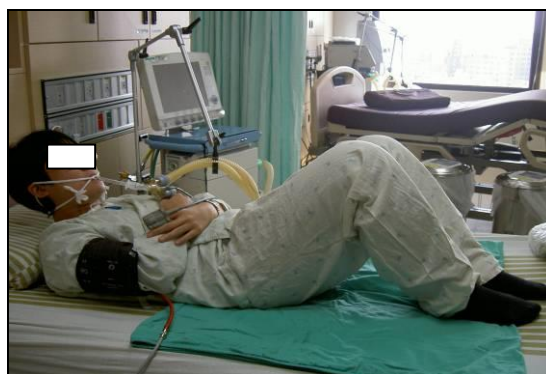
圖十八 雙手交叉於胸前，用腹部力量抬高頭部及肩部