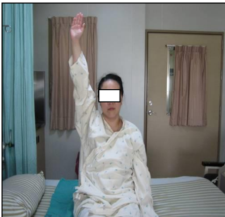
圖五 左手平直抬高過肩