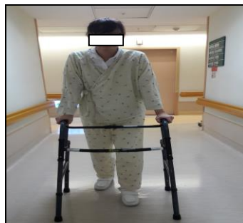
圖十六 使用輔助物步行