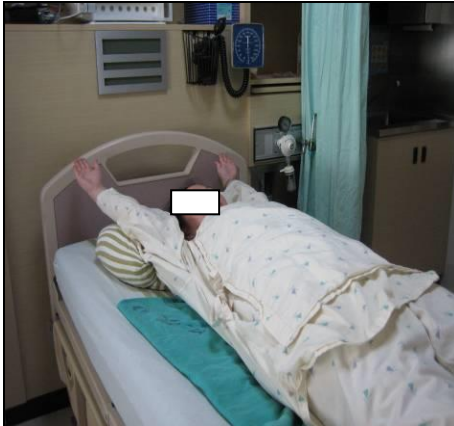
圖三 平躺-雙手平直抬高過肩