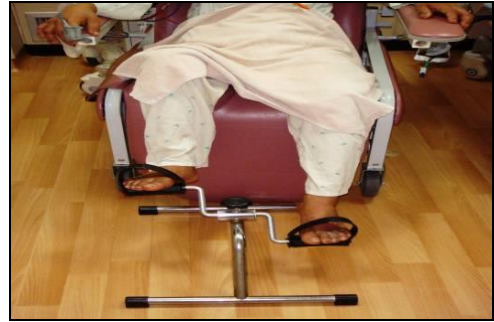
圖十四 坐椅子踩腳踏車