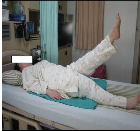
圖十 左腳平直抬高 45 度