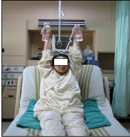
圖七 握住等重水瓶，平直抬高過肩